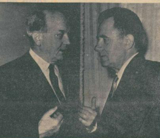
NEW YORK — Il segretario di Stato americano, Rusk, e il ministro degli Esteri sovietico, Gromyko, durante il loro incontro...